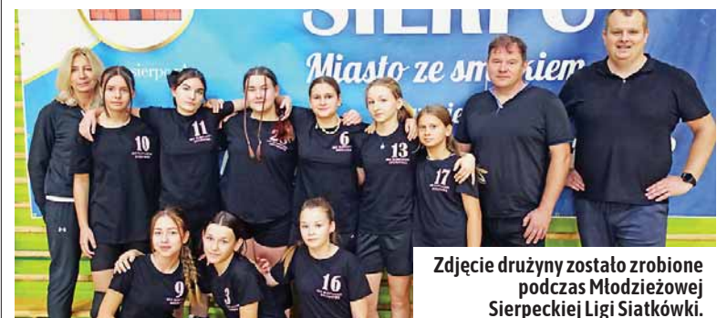
Zdjęcie drużyny zostało zrobione podczas Młodzieżowej Sierpeckiej Ligi Siatkówki.

Nikt nie obiecuje, że będzie łatwo. Jednak warto spróbować, aby poczuć smak zwycięstwa. Trwaj nabor do siatkarskiej drużyny dziewcząt.