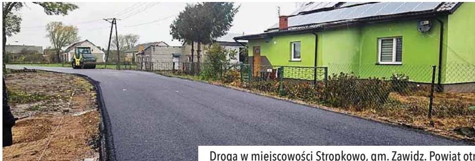
Droga w miejscowości Stropkowo, gm. Zawidz. Powiat otrzymał na jej wykonanie dofinansowanie z FOGR.

Trwa budowa dróg w powiecie sierpeckim. Już niedługo będzie można w pełni korzystać z nowych nawierzchni na czterech zmodernizowanych odcinkach.