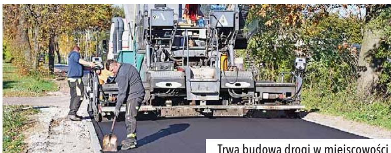
Trwa budowa drogi w miejscowości Białe Błoto, gmina Sierpc.