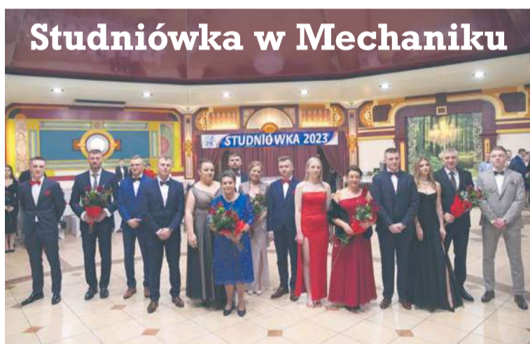
Studniówka w Mechaniku