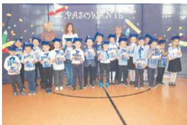
Szkoła Podstawowa w Bożewie

Zanim to nastąpiło dzieci zaprezentowały w każdej ze szkół przygotowany przez siebie program artystyczny. Po pięknie wyrecytowanych wierszach i zaśpiewanych piosenkach następowały najważniejsze momenty uroczystości. Dzieci złożyły uroczyste ślubowania, w których obiecywały uczyć się pilnie, dbać o dobro swojej szkoły oraz klasy, szanować ludzi i być dobrymi Polakami. Następnie każde