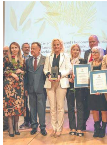
Nagroda dla Muzeum

Pięć maturzystek z Collegium Leonium w Sierpcu z nauczyciel-