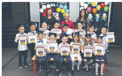
Szkoła Podstawowa w Mochowie

Na każdej z uroczystości byli zaproszeni goście, rodzice, uczniowie i nauczyciele, którzy z dumą patrzyli, jak pierwszoklasiści oficjalnie wkraczają w świat