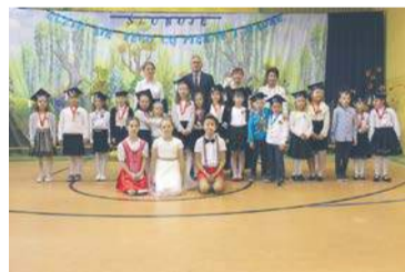
Szkoła Podstawowa w Ligowie

z nich zostało pasowane przez dyrektora swojej szkoły dużym ołówkiem na „pełnoprawnych” uczniów. Wszystkie dzieci wzorowo zdały swój pierwszy egzamin, udowadniając, że zasłużyły na zaszczytne miano ucznia szkoły podstawowej.