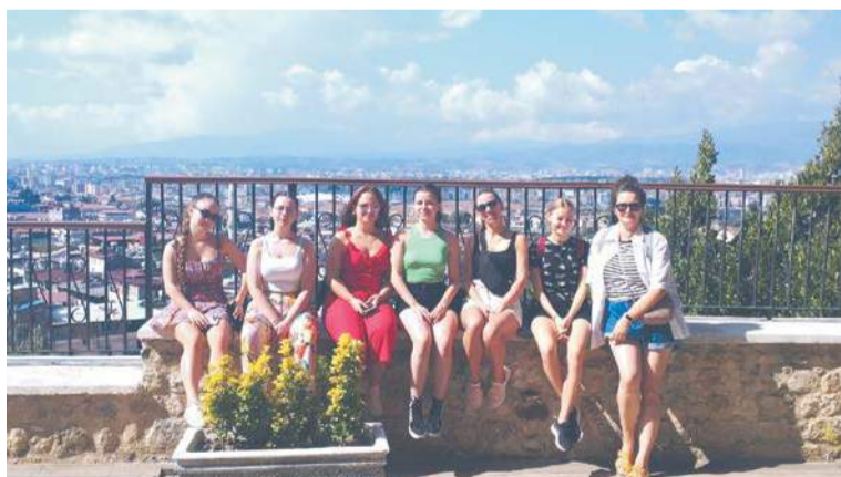
Leonium i Erasmus+

Władze samorządowe Miasta Sierpca i Powiatu Sierpeckiego zapraszają na obchody 104. rocznicy odzyskania przez Polskę niepodległości. Uroczystości odbędą się 11 listopada 2022 r. w asyście honorowej 64. Batalionu Lekkiej Piechoty. Rozpoczną się o godzinie 11.30 od okolicznościowych wystąpień i złożenia kwiatów pod pomnikiem marszałka Józefa Piłsudskiego (parking przed Centrum Kultury i Sztuki w Sierpcu). Następnie uczestnicy, tworząc korowód, przemarszują do kościoła pw. św. Wita, Modesta i Krescencji w Sierpcu, gdzie ok. godz. 13.00 odprawiona zostanie msza święta w intencji ojczyzny. Po jej zakończeniu, ok. godz. 14.00, nastąpi uroczyste otwarcie zmodernizowanego Ratusza.