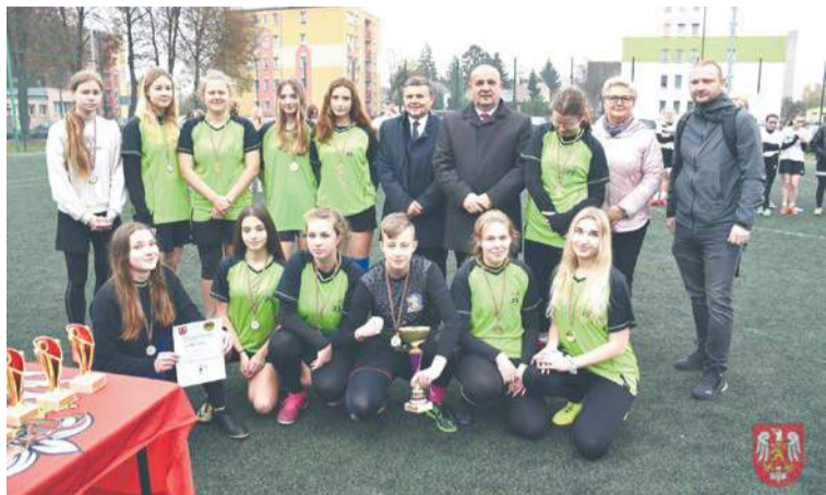
Turniej Piłki Nożnej Dziewcząt o puchar Starosty Sierpeckiego