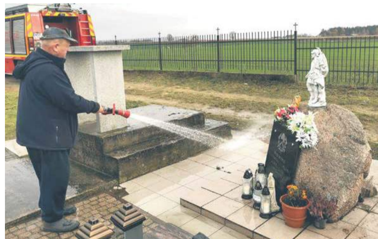
Akcja OSP Gozdowo